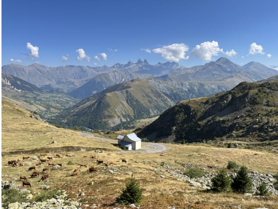
Col de la Glandon

Auch so ein schöner Urlaub geht einmal zu Ende und so stand die Heimfahrt an.