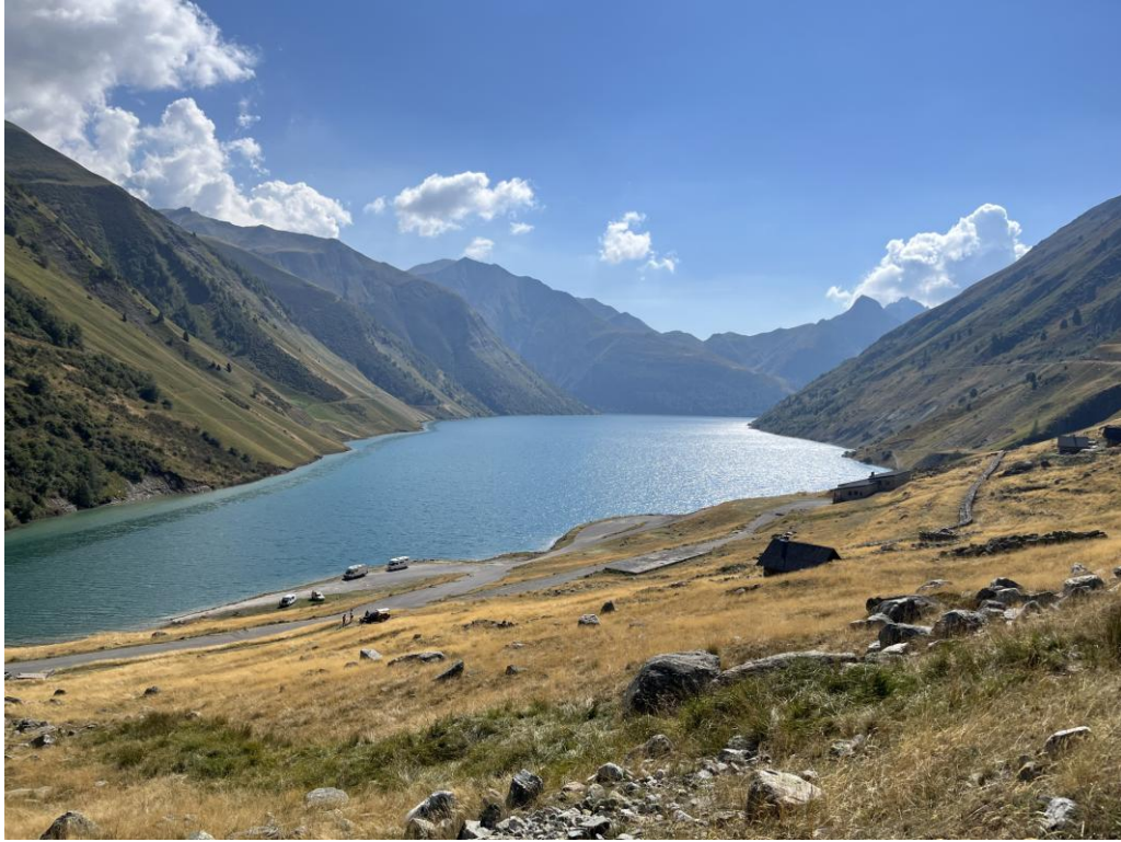
Stausee am Col de la Croix de Fer