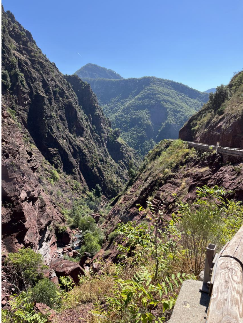
Gorges du Cians