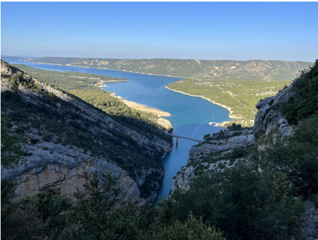
Lac de Saint Croux