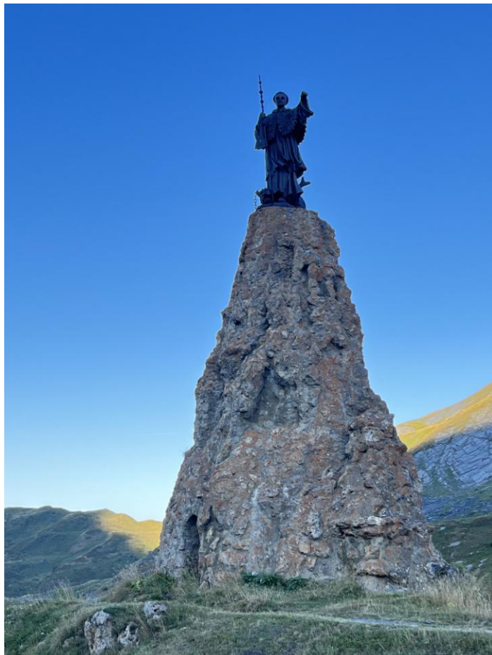
Kl. St. Bernhard

Die Strecke führte über den Kleinen St. Bernhard, das Aosta Tal und den Großen St. Bernhard nach Martigny. Von dort ging es über die Autobahn wieder in die Heimat.