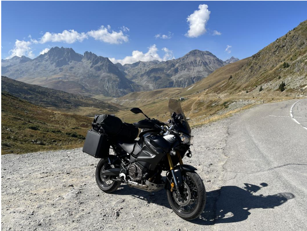
Col de la Croix de Fer