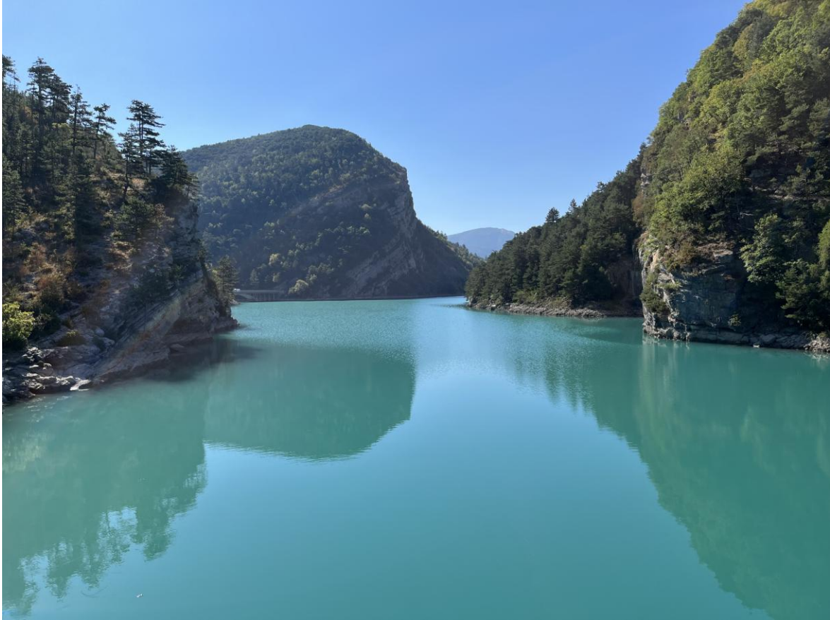
Lac de Castillon

Die Enge der Cianschlucht und die rotbraune Farbe des Gesteins haben etwas Mystisches an sich und beeindrucken ungemein.