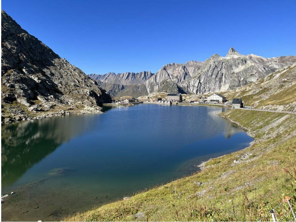
Gr. St. Bernhard

Am 09.09.23, gg. 16.30 Uhr, traf ich wieder wohlbehalten zu Hause ein. Ich hatte ein paar sehr schöne Tage und war insgesamt 2900 km gefahren.