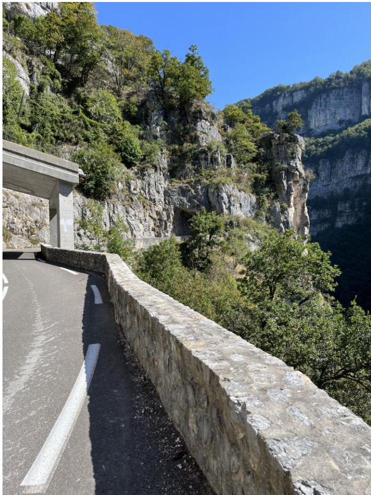
Gorges de la Bourne