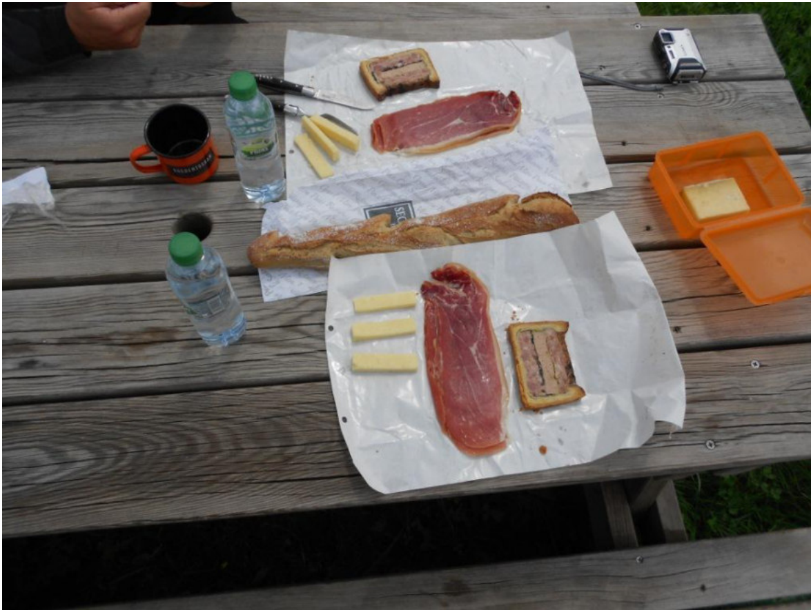
Kleine Zwischenmahlzeit am Nachmittag

Sehr beeindruckend, rund 140 Jahre alt und funktioniert. Warum die Brücke im zarten rosa gestrichen wurde, erschloss sich uns nicht. Am frühen Nachmittag bunkerten wir Wasser und ein paar Kleinigkeiten zu Essen, um kurz darauf eine passende Stelle für ein kleines Picknick zu finden.