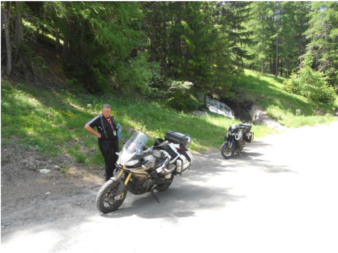
Kurze Rast unterhalb vom Montcenis

Bereits um kurz nach 7 ging es ohne Frühstück los. Bloß weg hier und unser neuer Plan war, über den Col de Vars, Col Montcenis, Col d'Iseran und Col Petit Bernhard ins Aostatal zu fahren. Den Col d'Izoard haben wir ausgelassen. Wir begannen also bei kühlen Bedingungen die Anfahrt zum Col de Vars. Die Kiefern dufteten intensiv vom Regen des Vorabends. Der Col de Vars war in einem besseren Zustand, als bisher gewohnt. Es ging über Guillestre und Briancon Richtung Col de Montgenevre. Die Nationalstraße über rund 30 km bis Susa auf italienischer Seite war bei der Hitze nicht ganz der Hit, aber dafür fanden wir dort erneut ein sehr schönes Lokal, die Bar „Taverna dei Sapori“. Spitzenmäßiges 2 Gänge Menü mit Mineralwasser für 13,- Euro. Im Ort holte ich Wasser und weil unsere Absacker leer waren, auch noch eine kleine Flasche Grappa. Irgendwo in der Abfahrt vom Montcenis fanden wir ein schattiges Plätzchen an einem rauschenden Bach für eine kurze Siesta mit Wasseraustausch.