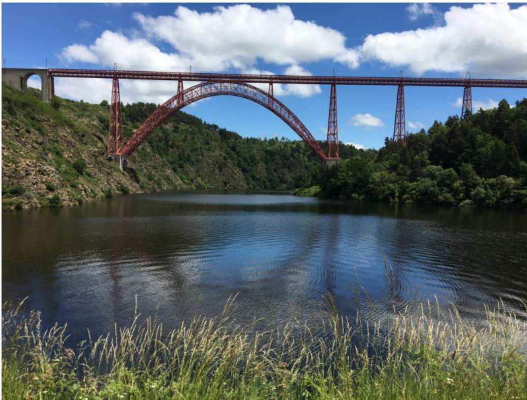
Hat ja etwas vom Turm in Paris. Brücke von Gustave Eiffel

Es hatte in der Nacht zuvor noch leicht genieselt, aber bei der Abfahrt zogen die Dunstschwaden die Hänge hinauf und die Straßen wurden zusehends trocken. Nun war auf den TomTom's wieder kurvenreich mit unbefestigt erlaubt. So durchfuhren wir die Auvergne auf fast leeren Nebenstrecken in Richtung Cevennen. Unterwegs kamen wir an der Eisenbahnbrücke von Gustave Eiffel, dem Viadukt de Garabit, vorbei.