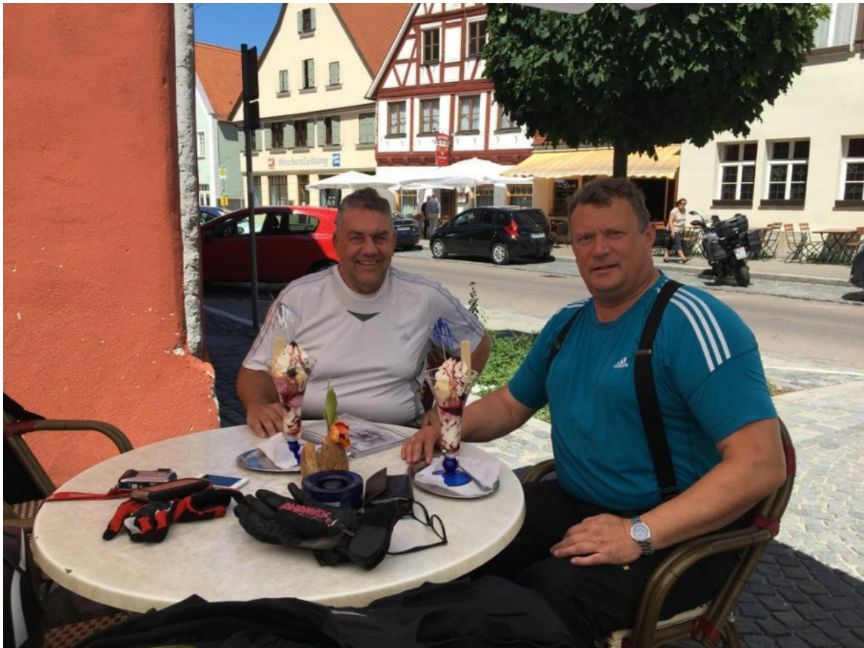
Der Abschluss Eisbecher in Nördlingen