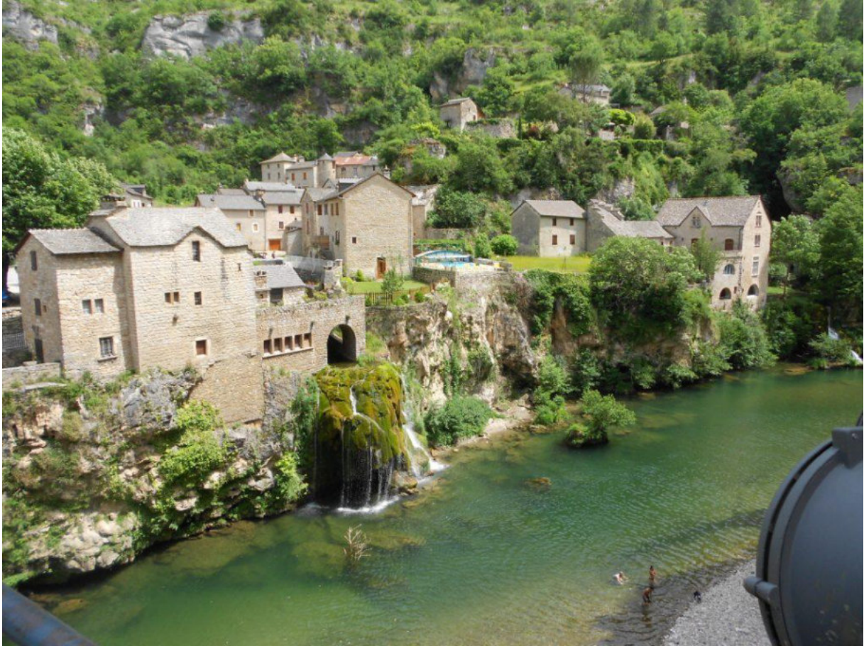
Saint Chely du Tarn

An einem Hang bei Fraissinet de Forques mit größeren Felsbrocken schwebte ein Geier im Aufwind. Leider waren wir nicht schnell genug, um das Riesentier auf die Linse zu bekommen. Unser Hotelrestaurant war wieder geöffnet und so klang der Abend wieder super aus. Es folgte das übliche Prozedere, wobei die Whiskyvorräte zur Neige gingen.