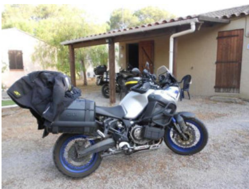
Ferienhütte in Le Muy

Nach gut anderthalb Stunden Pause ging es weiter. Es wurde zu heiß, um in diesem Tempo über die Rhone Ebene zu fahren, also gingen wir auf die Autobahn und fuhren bei Temperaturen von über 40 Grad, bis wir in der Nähe von Le Muy eine Unterkunft gefunden hatten. Jedes Bäuerchen unter dem Helm fühlte sich so an, als würde man mitten in einer Schafsherde stehen, während die Sonne versuchte, die Daytona Stiefel durchzuglühen. Unser kühles „Ankommensbier“ schmeckte dieses Mal besonders gut. Nachdem wir unsere Zimmer in schönen Ferienhäuschen des Parcs „Le Relais des Lavandines“ bezogen und uns frisch gemacht hatten, bekamen wir ein gutes Abendessen, während wir unsere Rüstungen, die ebenfalls etwas von einer Schafsherde hatten, zum Lüften aufgehängt hatten. Von der Terrasse des Restaurants aus konnten wir unterhalb vom Swimmingpool ein paar kleine Wildschweine bei der Futtersuche beobachten. Das war so 20 Meter von unseren Unterkünften entfernt. Als Dessert waren uns die Tierchen jedoch zu klein 😊.