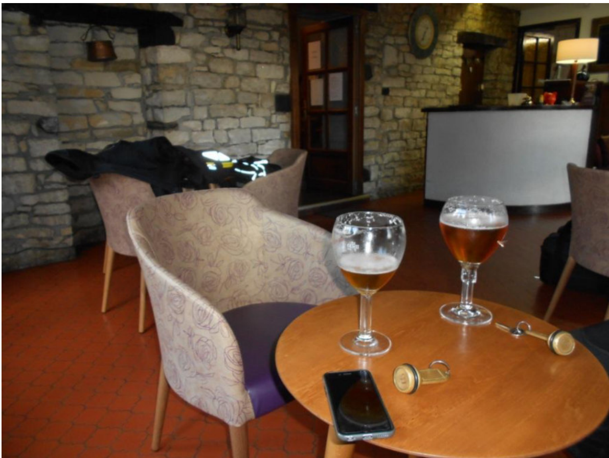
Das Ankommensbier vor dem Bezug der Zimmer beugt der völligen Unterhpfung vor

Durch die Vogesen über Bussang rollten wir uns zunächst gemütlich ein. Das Wetter war gut, wir schafften es durch Abweichungen von der TomTom Route den gut einschätzbaren Regenwolken auszuweichen und im Prinzip gab es bis hierhin nichts nennenswertes, außer, dass uns die Vogesen sehr gut gefallen hatten. Der Duft nach dem Regen war einfach super. Nachdem das Hotel am Col de Bussang ausgebucht war, haben wir die Richtung Pontarlier eingeschlagen und sind letzten Endes in einem äußerlich unscheinbaren Hotel „L'Auberge des Moulins“ in Pont les Moulins ausgekommen. Innen waren wir angenehm überrascht, denn die Zimmer und das Essen waren erste Klasse und trotzdem günstig. Es war ein langer erster Tag und so gingen wir nach dem Essen und einem Absacker rasch zur Nachtruhe über.