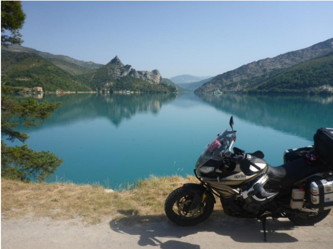
Fotostopp am Lac de Castillon

Ursprünglich war es unser Vorhaben, von Le Muy aus nach Barcelonnette zu fahren um dort eine Unterkunft zu finden und Mittags dort einzuchecken, damit wir ohne großes Gepäck die Runde über den Col de Cayolle und Col de Bonette fahren können. Wir führen also los und durch das Gebiet des Grand Canyon du Verdon, ohne jedoch direkt durch die Schlucht zu fahren. Das wäre ein kleiner Umweg gewesen und wir waren beide Seiten der Schlucht früher schon mal gefahren. So ging es direkt nach Castellane zum Tanken und von dort aus über die D2 zum Col d'Allos und weiter nach Barcelonnette.