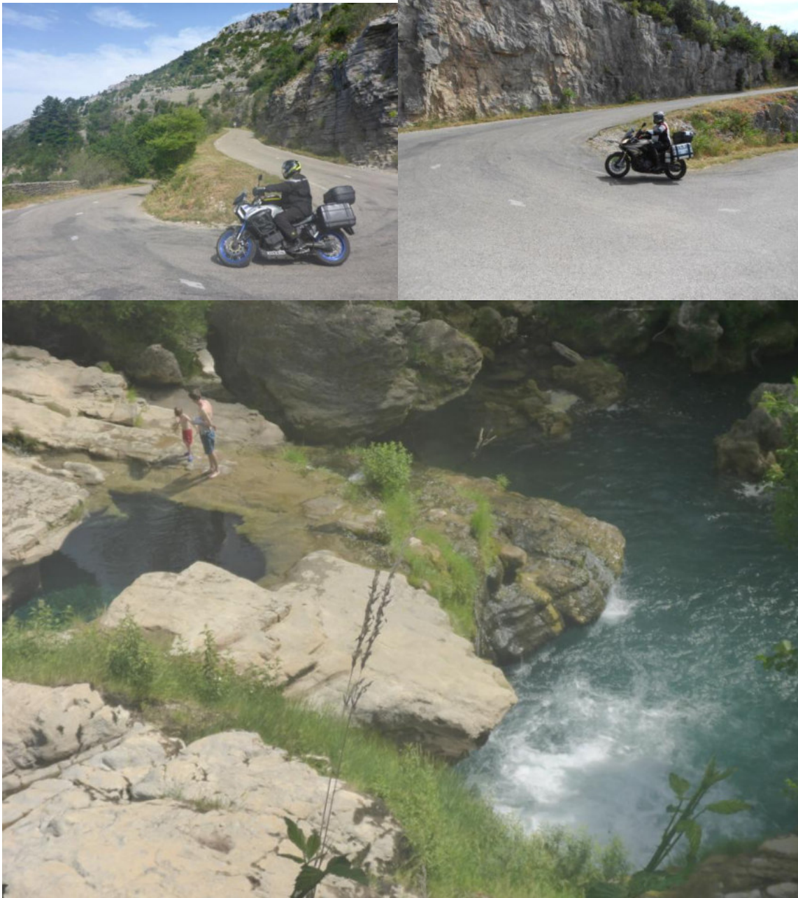
Am Cirque de Navacelles

Von dort aus ging es Richtung Nimes über Land. In einem Ort kurz vor Nimes kehrten wir an einem Marktplatz in einem Korsischen Restaurant zur Mittagsrast ein. Dort gab es unter anderem einen großen Burger mit Lammfleisch und Schafskäse überbacken, natürlich mit Knoblauch fein abgestimmt.