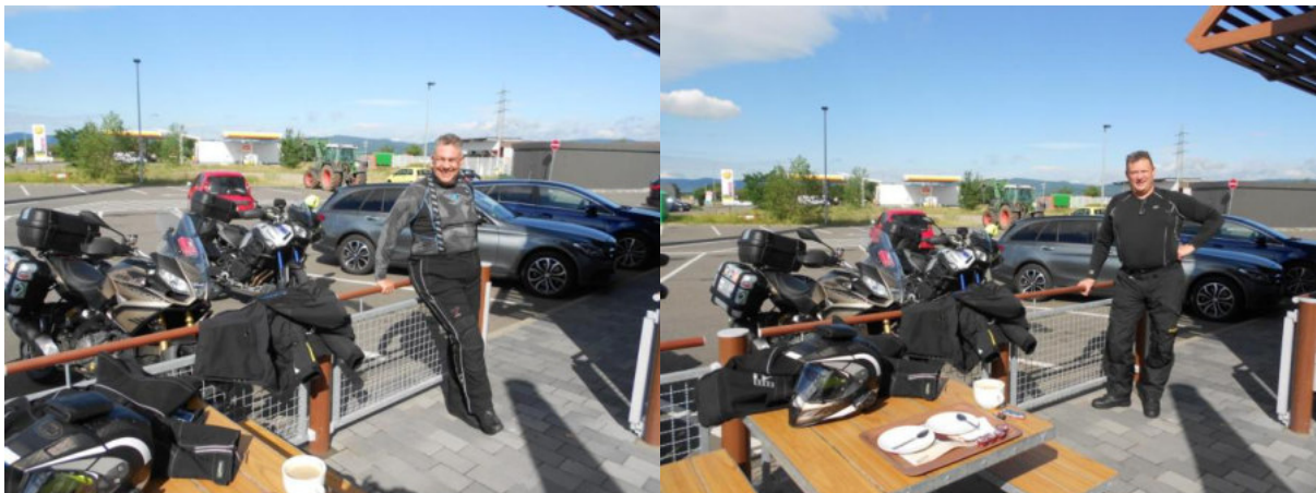
Startklar in Haßloch

Dennoch ging es dann zu zweit gegen 9:30 Uhr los.