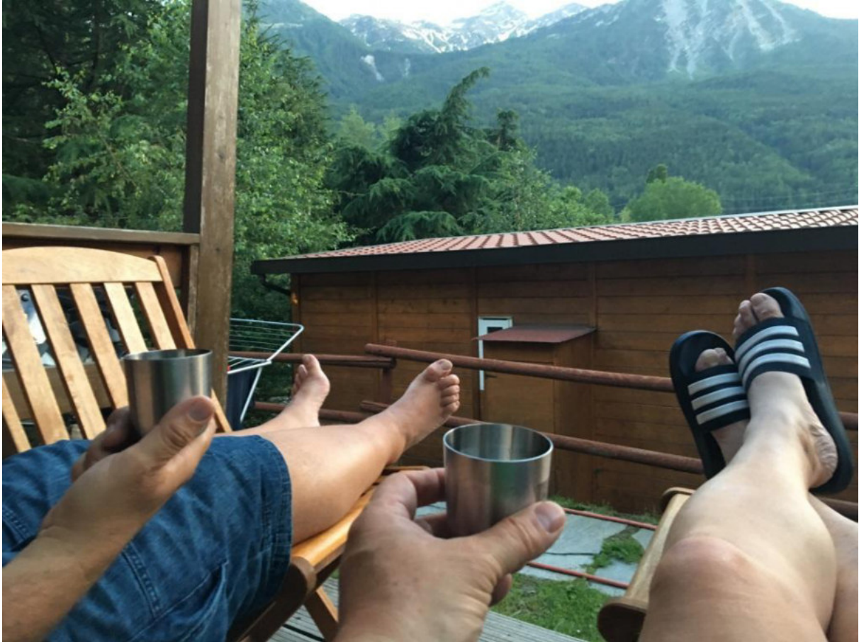
Abendlicher Blick ins Aostatal

Auch der Rest der Speisekarte lies sehr gutes erhoffen und Rainer hatte sich direkt in ein Kilo Cote de Boef verliebt. Es war eine Wucht. Als wir kurz nach 9 bezahlten, war der Laden rappellvoll und es standen noch einige vor dem Eingang und warteten auf Tische. Diese Unterkunft war ein Volltreffer. Essen, Gegend, Wetter und der Grappa als Absacker auf der schönen Terrasse mit Bergblick ließen den Tag gut ausklingen. Wegen der tollen Unterkunft u.a. mit Klimaanlage beschlossen wir, am nächsten Morgen erst kurz nach 8, also für unsere Verhältnisse spät, abzureisen.