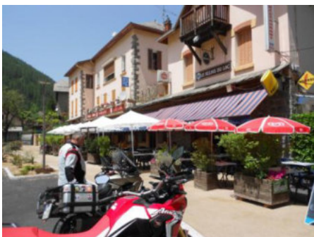
Dieses Superhotel wurde bei Booking mit „Gut“ bewertet...tsss, tsss

Dort haben wir in Ruhe pausiert, uns ein wenig gestärkt und im Internet nach einer Herberge gesucht, die wir in Le Lauzet-Ubaye gefunden hatten. Das dortige Hotel „Le Relais du Lac“ war zwar günstig, aber bedeutete auch den Qualitätstiefststand der Tour.