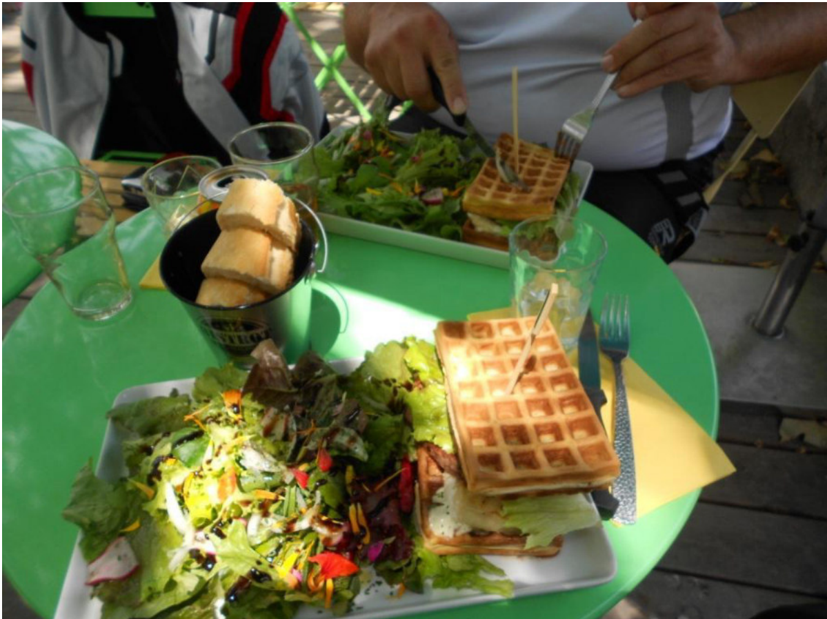
Korsischer Schäfchenburger mit Schäfchen überbacken und Knofi

Nach gut anderthalb Stunden Pause ging es weiter. Es wurde zu heiß, um in diesem Tempo über die Rhone Ebene zu fahren, also gingen wir auf die Autobahn und fuhren bei Temperaturen von über 40 Grad, bis wir in der Nähe von Le Muy eine Unterkunft gefunden hatten. Jedes Bäuerchen unter dem Helm fühlte sich so an, als würde man mitten in einer Schafsherde stehen, während die Sonne versuchte, die Daytona Stiefel durchzuglühen. Unser kühles „Ankommensbier“ schmeckte dieses Mal besonders gut. Nachdem wir unsere Zimmer in schönen Ferienhäuschen des Parcs „Le Relais des Lavandines“ bezogen und uns frisch gemacht hatten, bekamen wir ein gutes Abendessen, während wir unsere Rüstungen, die ebenfalls etwas von einer Schafsherde hatten, zum Lüften aufgehängt hatten. Von der Terrasse des Restaurants aus konnten wir unterhalb vom Swimmingpool ein paar kleine Wildschweine bei der Futtersuche beobachten. Das war so 20 Meter von unseren Unterkünften entfernt. Als Dessert waren uns die Tierchen jedoch zu klein 😊.