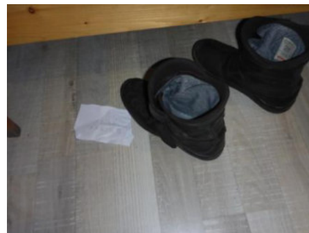
Achtung, bald kommt die Geruchsapp für's Fotohandy ☺