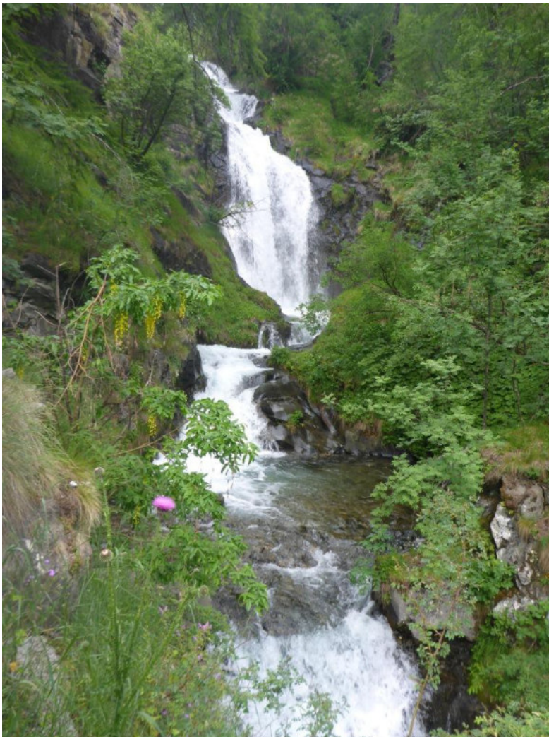
Wasserfall bei der Auffahrt zum Bonette von Süden aus

Trotzdem ging es auch mal mit niedriger Hotelqualität, weil die höhere Priorität ja auf der Rundfahrt durch die Berge ohne Gepäck lag und nicht in Luxusunterkünften auszuruhen. Nachdem wir unsere Sachen nur ins Zimmer gebracht hatten, ging es bei großer Hitze um die 40 Grad hoch auf den Col de Cayolle. Die Flucht in die Alpen hatte uns temperaturmäßig nicht viel weiter gebracht. Dort waren wir ja vor einigen Jahren schon mal, jedoch damals bei Regen und Schnee auf dem Gipfel mit Schneematsch auf den Straßen. Dieses Mal war es heiß und voll dort oben. Nur eine sich rasch nähernde Gewitterfront aus der Richtung, aus der wir kamen, mahnte uns zur baldigen Weiterfahrt. Also ging es weiter über Col de Valberg und Col de Cuilolle zum Col de Bonette. Den Bonette sind wir mehrfach in Richtung Süd gefahren und haben nie den sehr schönen Wasserfall gesehen, der uns nun förmlich vor die Linse sprang.